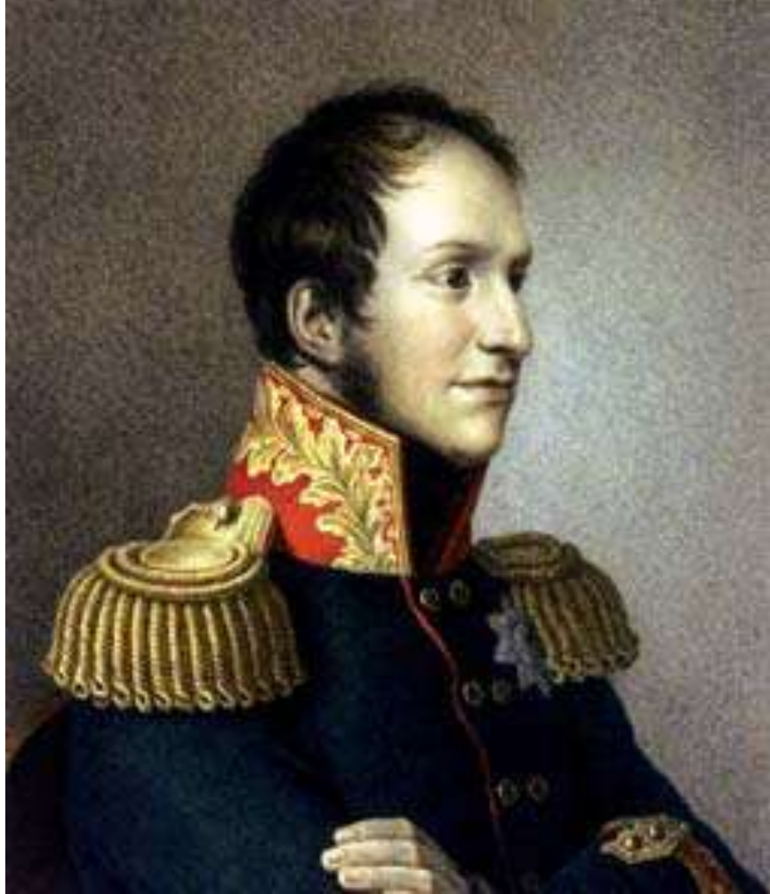
Пётр Фридрих Георг Ольденбургский