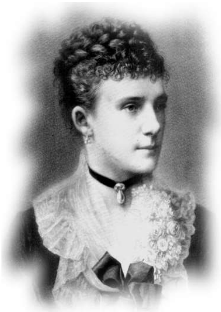
Евгения Максимилиановна Ольденбургская