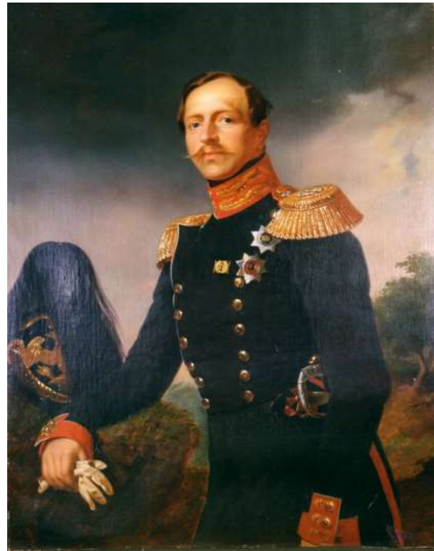
Пётр Георгиевич Ольденбургский