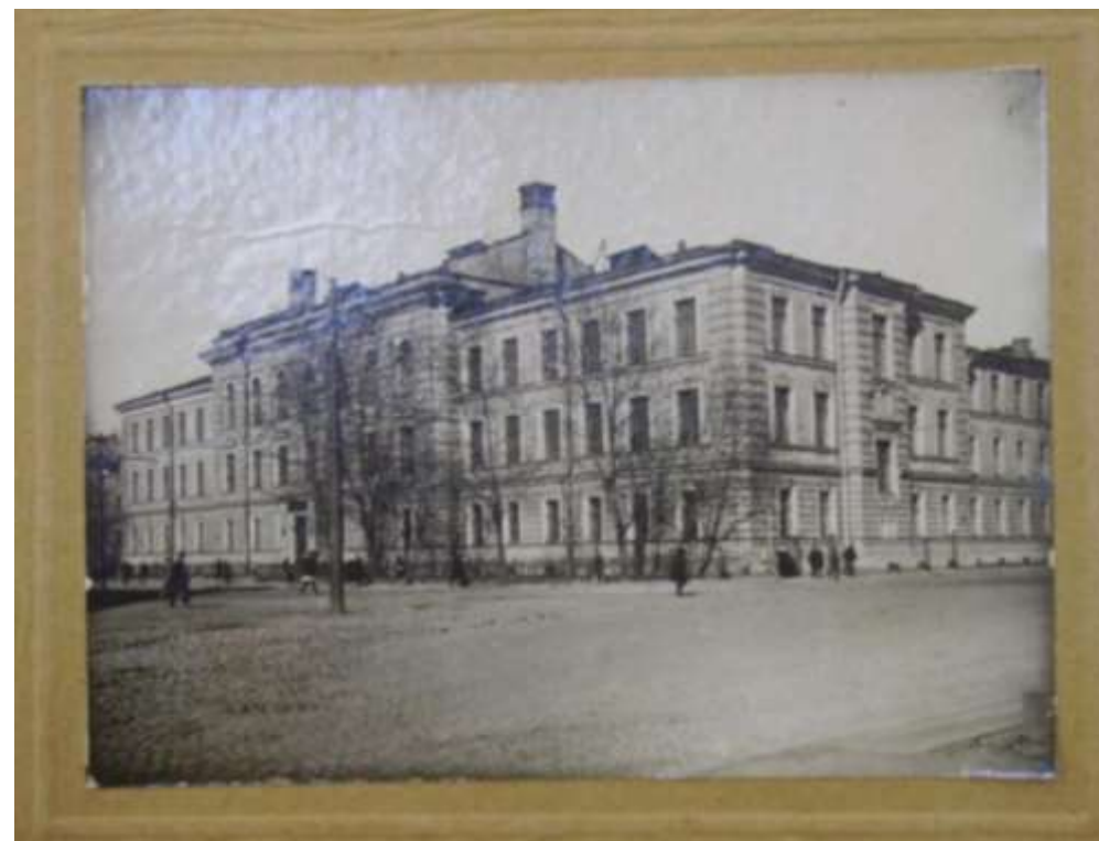
Гимназия принцессы Ольденбургской