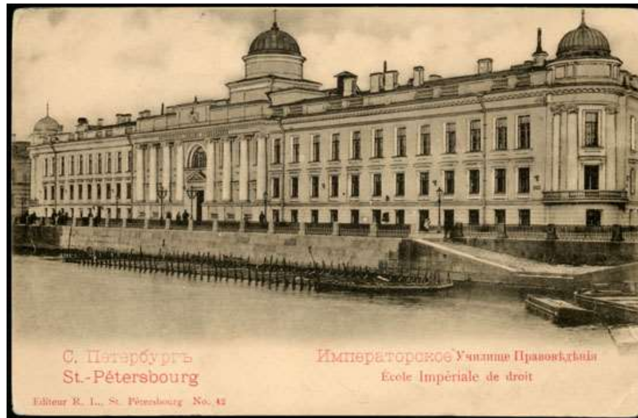
Училище правоведения на наб. реки Фонтанки, д. 6