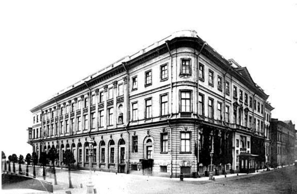
Дворец Ольденбургских у Летнего сада