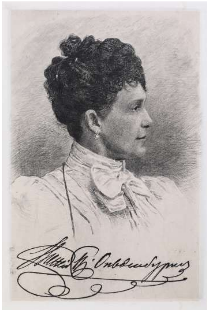
Евгения Максимилиановна Ольденбургская