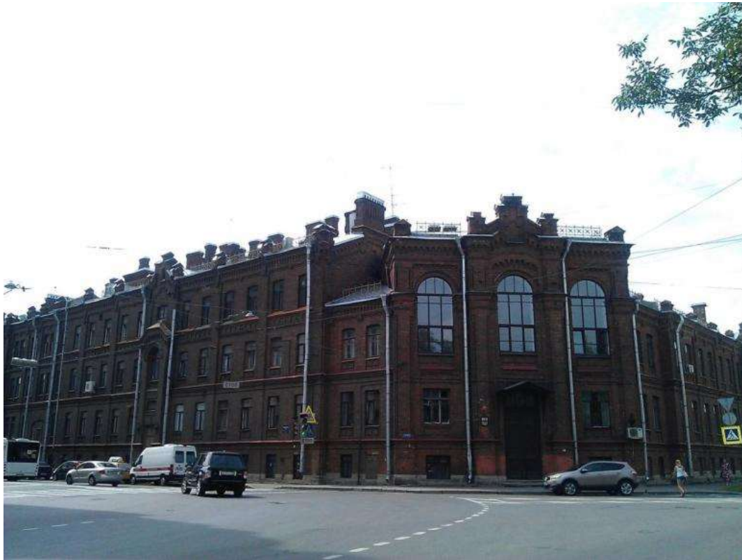
Здание Общины сестёр милосердия св. Евгении