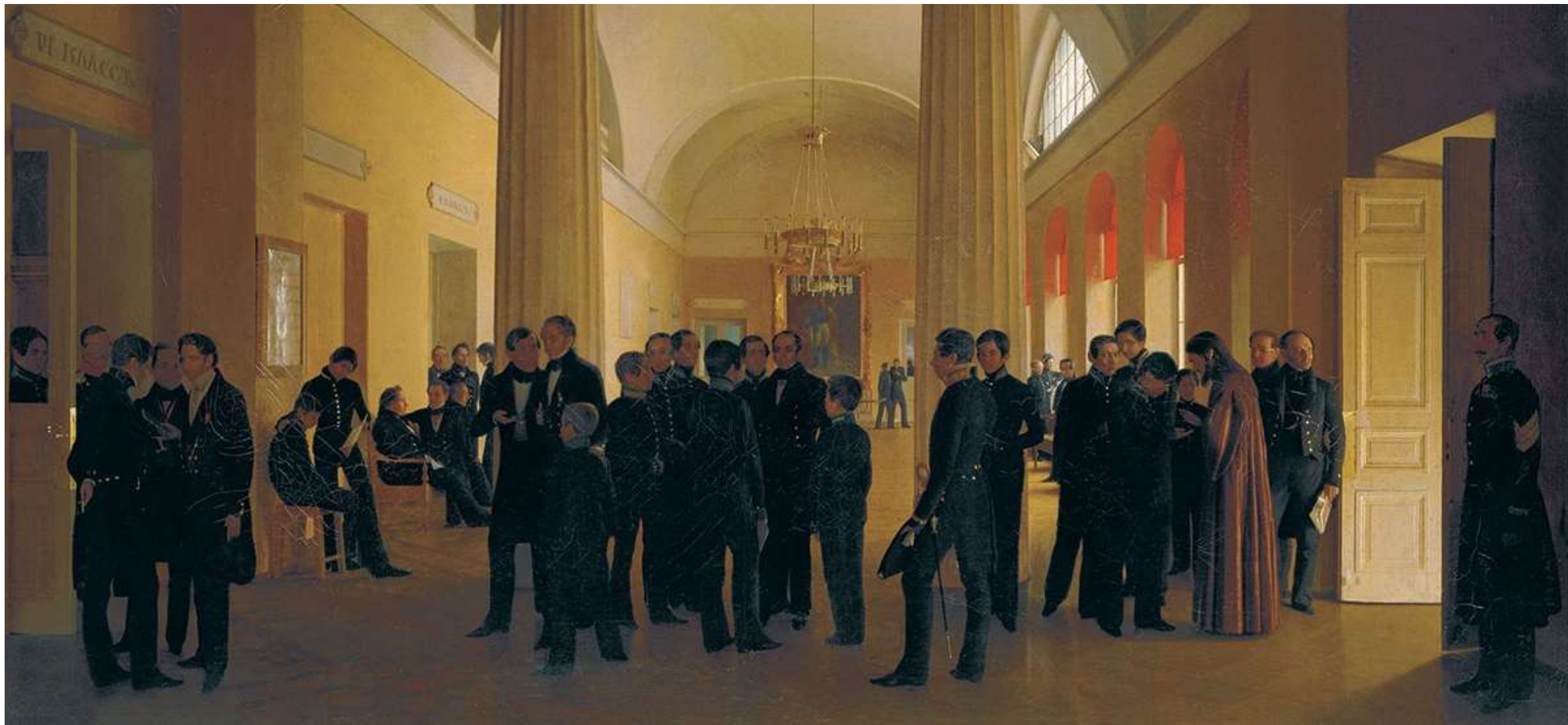
С.К. Зарянка «Зал Училища правоведения с группами учителей и воспитанников»