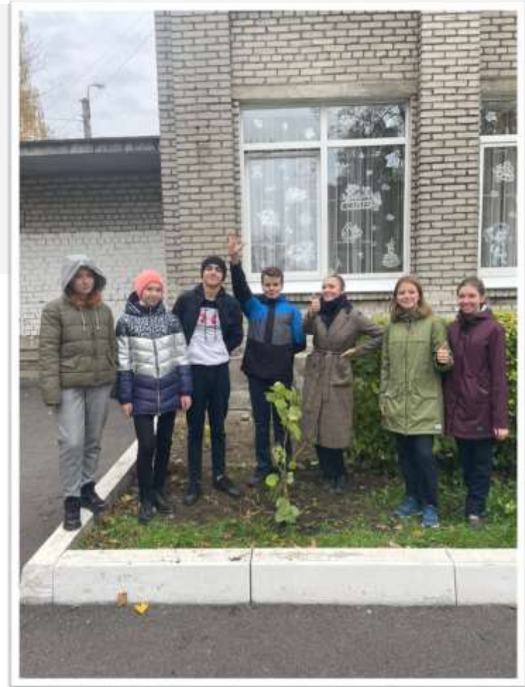
Литературно-экологический проект “Природа, мир, тайник вселенной”